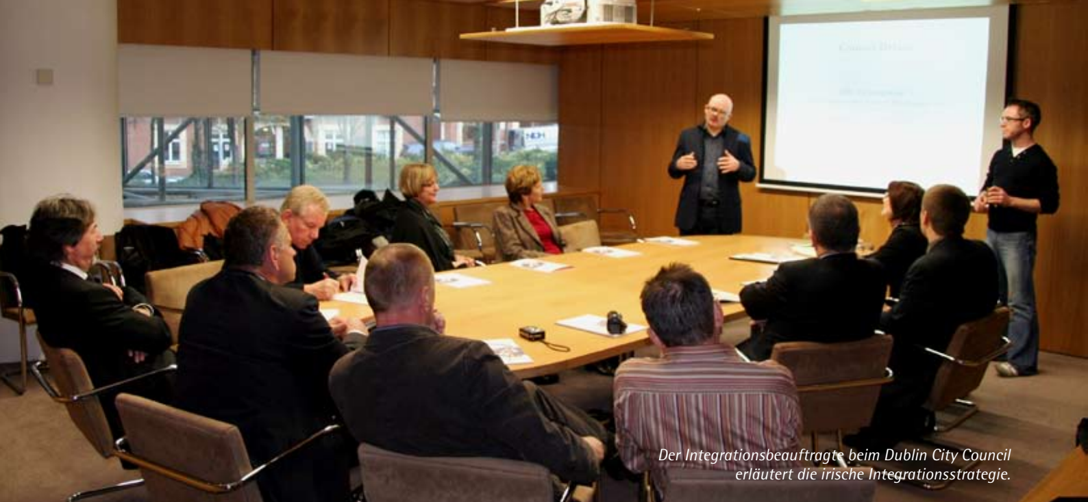
Der Integrationsbeauftragte beim Dublin City Council erläutert die irische Integrationsstrategie.