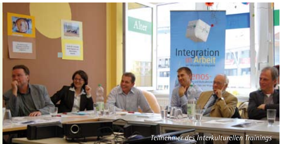
Teilnehmer des Interkulturellen Trainings