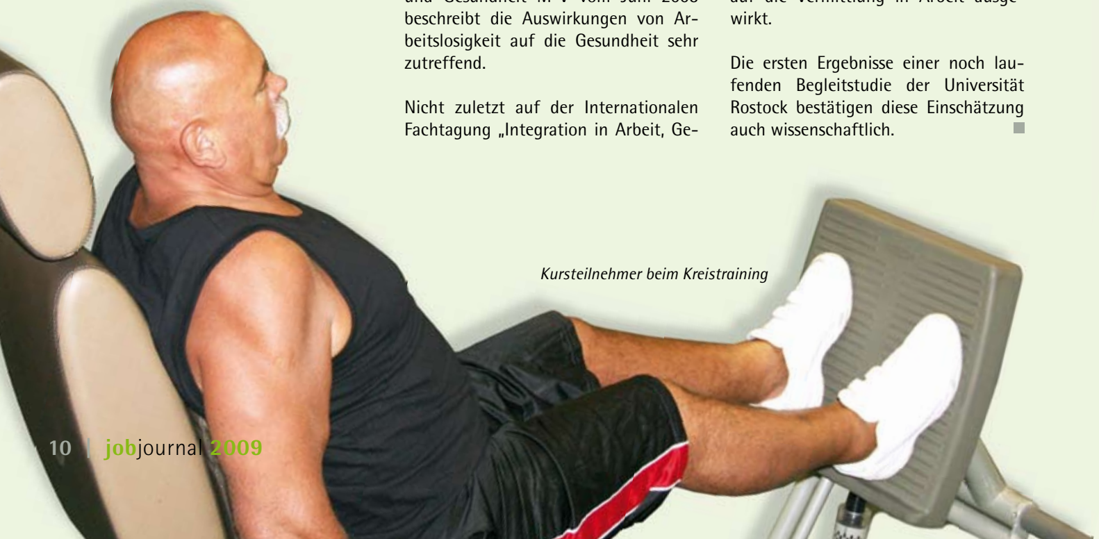
Kursteilnehmer beim Kreistraining

Die ersten Ergebnisse einer noch laufenden Begleitstudie der Universität Rostock bestätigen diese Einschätzung auch wissenschaftlich. ■