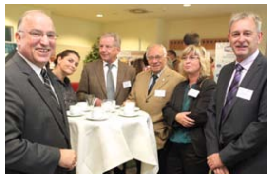
Netzwerkpartner aus der Stadtverwaltung, der Agentur für Arbeit und der ARGE n